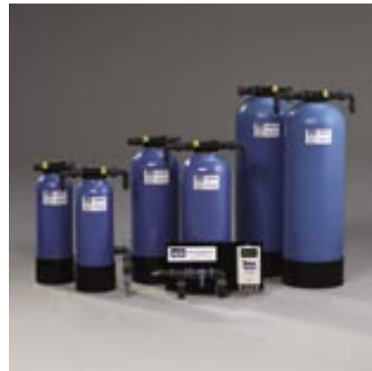
DemiMix med en kapacitet på 200 - 1100 liter v/20°dH.