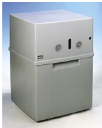
RO-114 serie for en-tanksopvaskemaskiner med større vandforbrug.