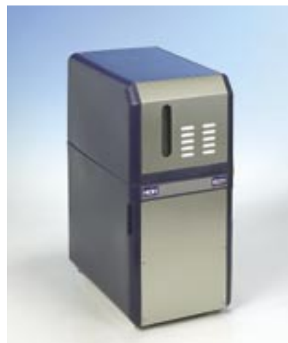
RO-51 kompakt anlæg med indbygget reservoir og pumpe. For en-tanksopvaskemaskiner.