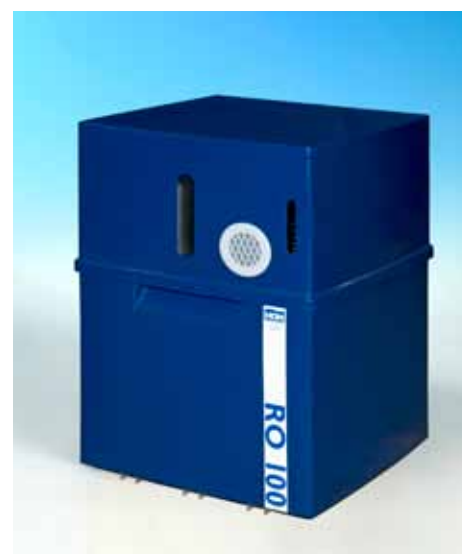
RO-51 og RO-100 leverer totalt afsaltet vand som er en nødvendighed for AQUA Controller.