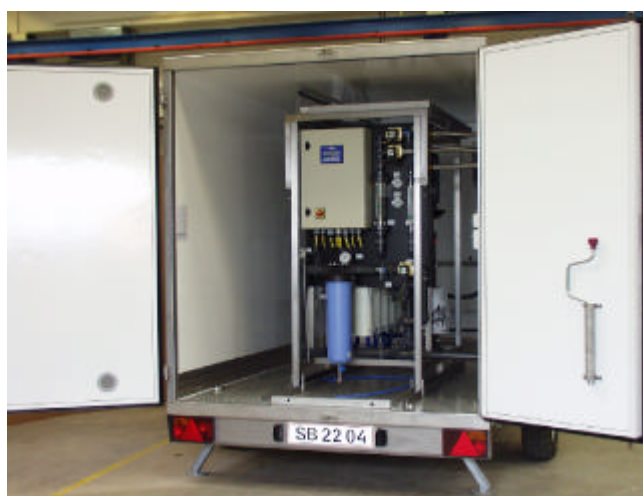
Traileren anlæg skal blot tilsluttes el, til- og afløb og kan være funktionsklar inden for få timer.