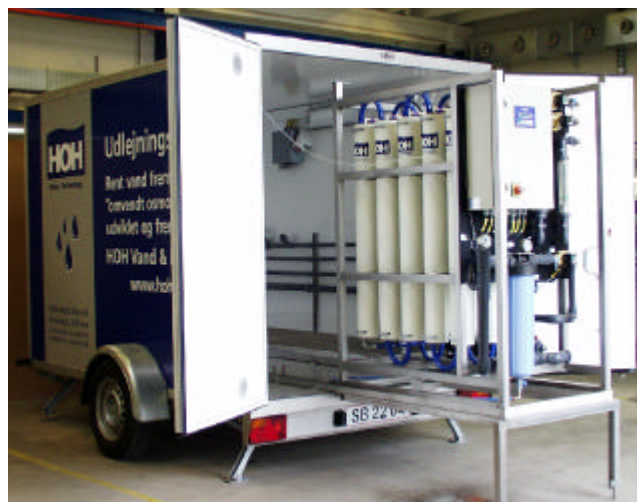
RO-anlægget er installeret i et skinnedsystem, så det er let at trække ud for service.